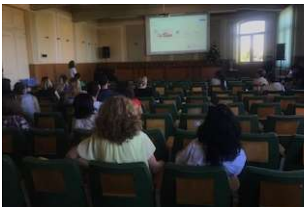
Τελικό Συνέδριο στη Ρουμανία