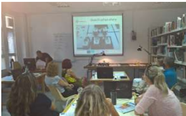
Τελικό Συνέδριο στην Ελλάδα