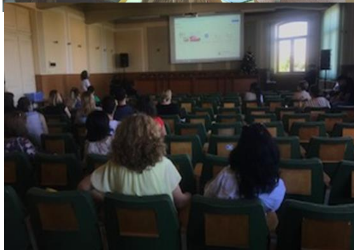
Eveniment de multiplicare România