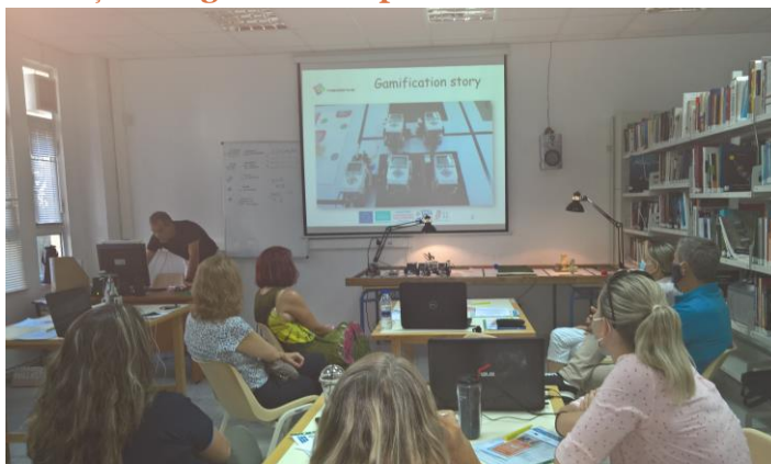
Eveniment multiplicare Grecia