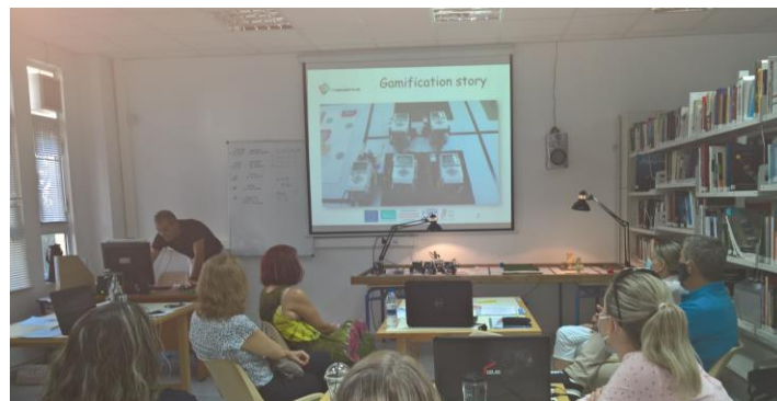
Evento final en Grecia