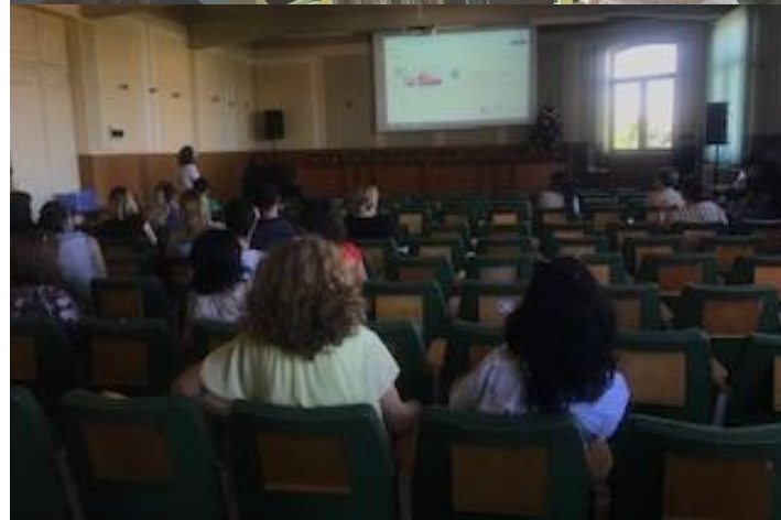
Evento final en Rumania