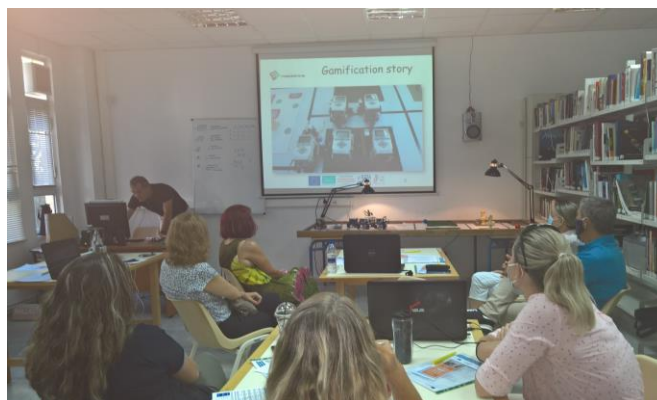
Événement final en Grèce