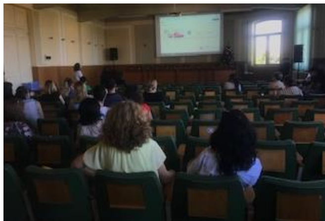
Événement final en Roumanie